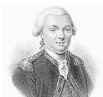
Jean-François de Galaup, comte de Lapérouse.

« Dans le sillage de Lapérouse », conférence de Norbert L'Hostis au château d'Anthès, dimanche 15 février à 17h, entrée libre.