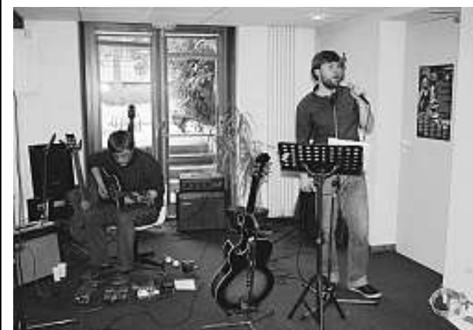
Wolke a fait le spectacle samedi à la médiathèque.

■ Wolke, duo guitare-voix, était à l'affiche samedi au micro concert de la médiathèque de Soultz. Durant leur tour de chant, les compères ont interprété quelques unes de leurs compositions. Des œuvres qui rappellent le folk américain de Smog, ou les tentatives electro-folk de Tunng, les chansons du duo sont aussi à rapprocher de celles des poètes de la pop française, Jean-Louis Murat, Daniel Darc. En complément de la guitare, le duo utilise une pédale pour élargir les harmonies et donner du corps aux compositions. Une agréable ballade aux rythmes et aux sons aussi variés qu'inattendus.